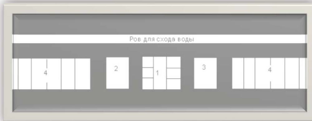
Рис. 1. Схема Таганрогской портовой таможни (1798 г.)

Таганрогская таможня располагалась рядом с крепостью на берегу Азовского моря. Купеческая гавань имела длину 384 м и ширину 171 м и отделялась стеной от воинской гавани. От таможни вдоль берега шли две дороги: одна до купеческих пакгаузов, другая – до города. Со стороны воинской гавани, на море, была построена стена «для охранения от южного ветра приходящих в гавань кораблей». Позади таможенного комплекса был вырыт ров для схода воды 1 .