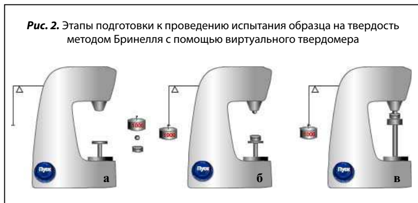
Рис. 2. Этапы подготовки к проведению испытания образца на твердость методом Бринелля с помощью виртуального твердомера

На рис. 2. показаны этапы подготовки к проведению испытания образца: требуется мышкой переместить образец, индентор и нагрузку в правильные позиции (рис. 2а, б), добиться соприкосновения индентора и образца (рис. 2в) и начать испытание (нажать на кнопку «Пуск» – аналогично включению электродвигателя и приложению нагрузки к образцу в реальном твердомере).