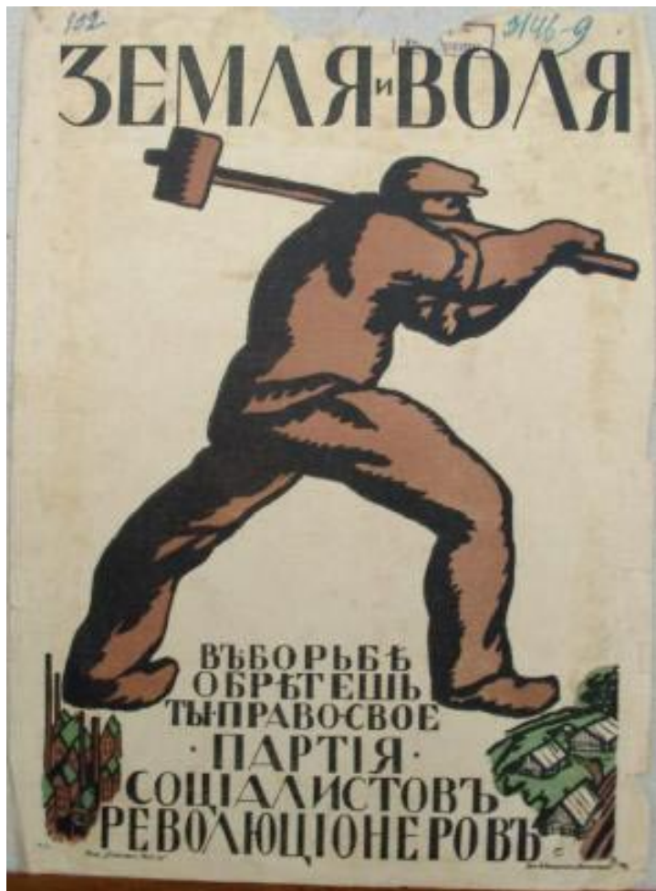
Рис. 1. Политический плакат ПСР, нацеленный на рабочий электорат [2]

тинги, шествия и собрания. Одним из видов собраний стали банкеты. Либеральные партии занимались изданием своей партийной литературы. В силу политических взглядов либеральных партий их усилия были направлены на работу в Государственной Думе, земствах, дворянских собраниях (в основном «Союза 17 октября»). Таким образом, социалистические и либеральные партии использовали одинаковые методы взаимодействия с населением. Отличие заключалось лишь в тех электоральных кластерах и социальных слоях, на которые была направлена их агитационно-пропаган-