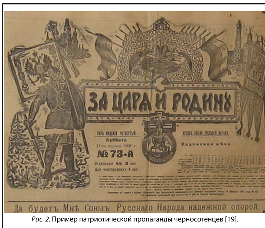
Рис. 2. Пример патриотической пропаганды черносотенцев [19].

дистская работа. Если структурировать эти методы, то следует выделить следующие уровни: