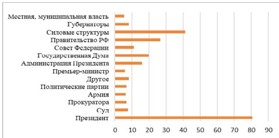
Рис. 2. / Fig. 2. Представления молодёжи о политических акторах, обладающих наибольшей властью / Youth Perceptions of Political Powerful Actors (%)

Стоит отметить, что за последнее десятилетие значимость политической роли Президента РФ и доверие к нему остаются в сознании граждан высокими [3; 14]. Согласно данным нашего исследования, наибольшей властью в современной России обладает Президент РФ, а затем уже силовые структуры, Правительство РФ, Государственная Дума РФ и Администрация Президента (рис. 2).