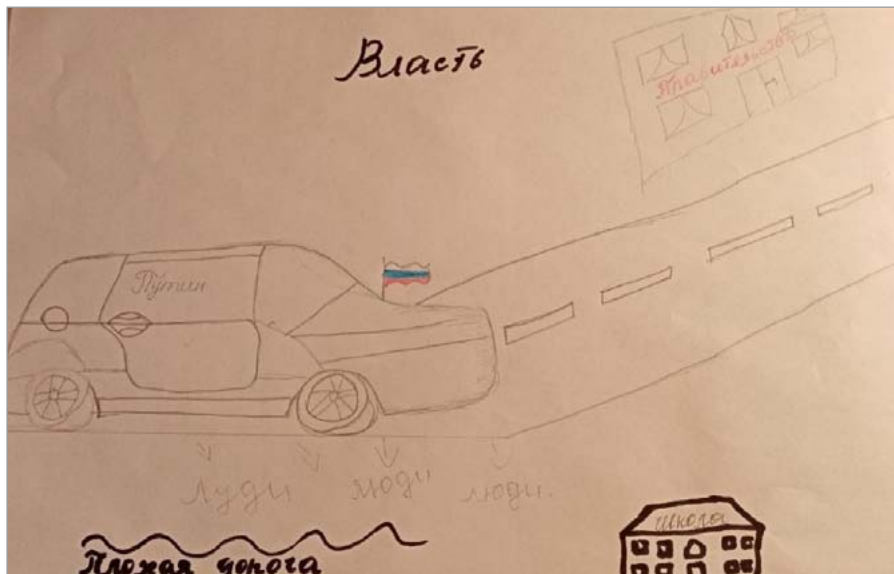
Рис. 2. / Fig. 2. Образ российской власти (женщина 20 лет, среднее образование, Брянск). / The image of Russian authorities (a woman of 20, secondary education, Bryansk).