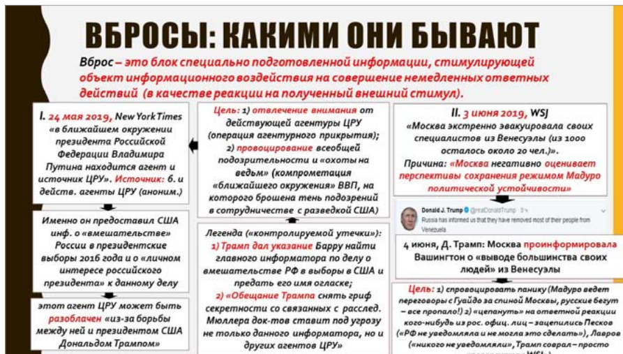
Рис. 1 / Fig. 1. Примеры информационных вбросов / Examples of planting disinformation

Вброс прекрасен тем, что он одновременно ударил сразу по двум фигурам: Д. Трампу (бывшему на тот момент Президентом США) и Президенту РФ В. В. Путину. Перед Д. Трампом сразу возникла вполне реальная перспектива получить обвинение в государственной измене: ведь именно из-за его настойчивого желания найти и разоблачить первоисточник сведений о российском вмешательстве в выборы (а точнее, о его связях с Кремлём) в окружении российского президента может быть раскрыт (и уничтожен) ценнейший агент. Сделав это, Трамп никогда не сможет доказать, что он оказал особо ценную услугу русской разведке не корысти ради (не по команде из Москвы), а ради искреннего и честного желания докопаться до истины. Напротив, скажут, что ради личной мести и желания свести счёты с обидчиками из разведсообщества он сознательно пренебрёг национальной безопасностью США. И тогда с ним будет то же, что и с Х. Клинтон, обвинённой ФБР в 2016 г. в государственной измене (в передаче секретной информации «Братьям-мусульманам» и ИГИЛ 7 ).