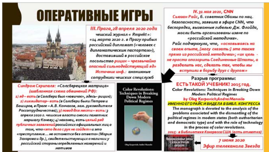
Рис. 3 / Fig. 3. Примеры оперативных игр (2020 г.) / Examples of operational games (2020)

– заявление бывшего советника Президента США по национальной безопасности Сьюзан Райс, сделанное ею в эфире CNN, о том, что «беспорядки, вызванные гибелью Дж. Флойда, могли быть организованы извне по “русской методичке”» (которую она видела своими глазами) 14 (рис. 3).