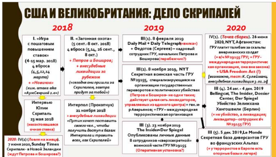
Рис. 5 / Fig. 5. «Дело Скрипалей» (2018–н. вр.) как классический пример информационной операции стратегического типа / The Skripals Case (2018 – present) as a classic example of a strategic information operation

играх), а именно того, ради которого эта операция разработана. Классическими примерами операций такого типа являются так называемые «Дело об отравлении Скрипалей» (начавшаяся в 2018 г., рис. 5) и «Венесуэльский прецедент» (операция по организации государственного переворота в Венесуэле, максимальная активность которой пришлось на 2019–2020 гг.).