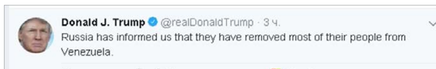
Рис. 2 / Fig. 2. Заявление Д. Трампа, сделанное им 4 июня 2019 г. в микроблоге Twitter / Donald Trump's statement on June 4, 2019 on Twitter

Для того чтобы усилить действие вброса, организаторы данной оперативной комбинации пошли на вовлечение в оперативную игру самого Президента США Д. Трампа, убедив его 4 июня 2019 г. (в Москве в это время была ночь) сообщить в своём микроблоге в Twitter о том, что Москва якобы проинформировала Вашингтон о «выводе большинства своих людей» из Венесуэлы (рис. 2).