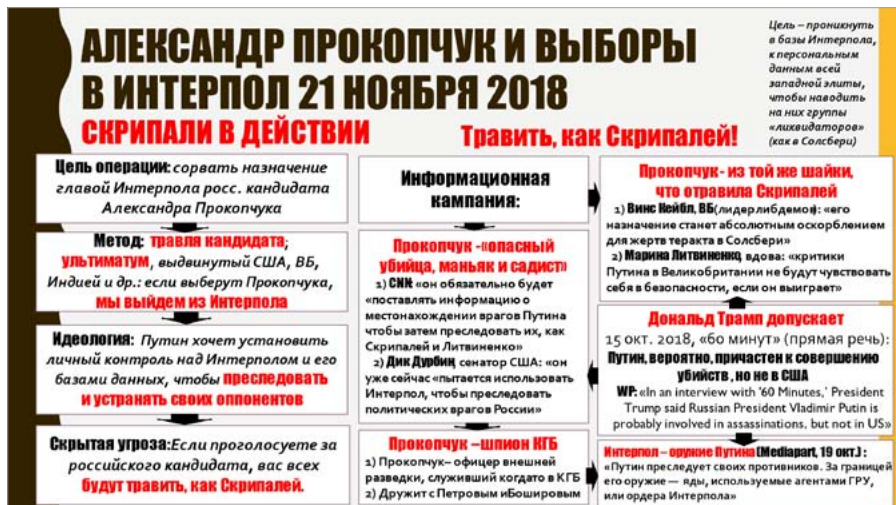
Рис. 6 / Fig. 6. Схема дискредитации российского кандидата на выборах главы Интерпола в 2018 г. / Scheme of discrediting a Russian candidate in the elections of the head of Interpol in 2018

б) дискредитация А. Прокопчука путём демонстрации его тесных («родственных») связей с «преступным» окружением («знаком с Петровым и Бошировым») с целью убедить всех в том, что Прокопчук также несёт ответственность за инцидент в Солсбери; неслучайно В. Кейбл, лидер либеральных демократов Великобритании, накануне выборов главы Интерпола заявил, что «его [Прокопчука] назначение станет абсолютным оскорблением для жертв теракта в Солсбери» 40 . Так Прокопчук в глазах западной общественности стал человеком, связанным с Петровым и Бошировым общей судьбой, а с Путиным – ещё и общим прошлым в КГБ СССР.