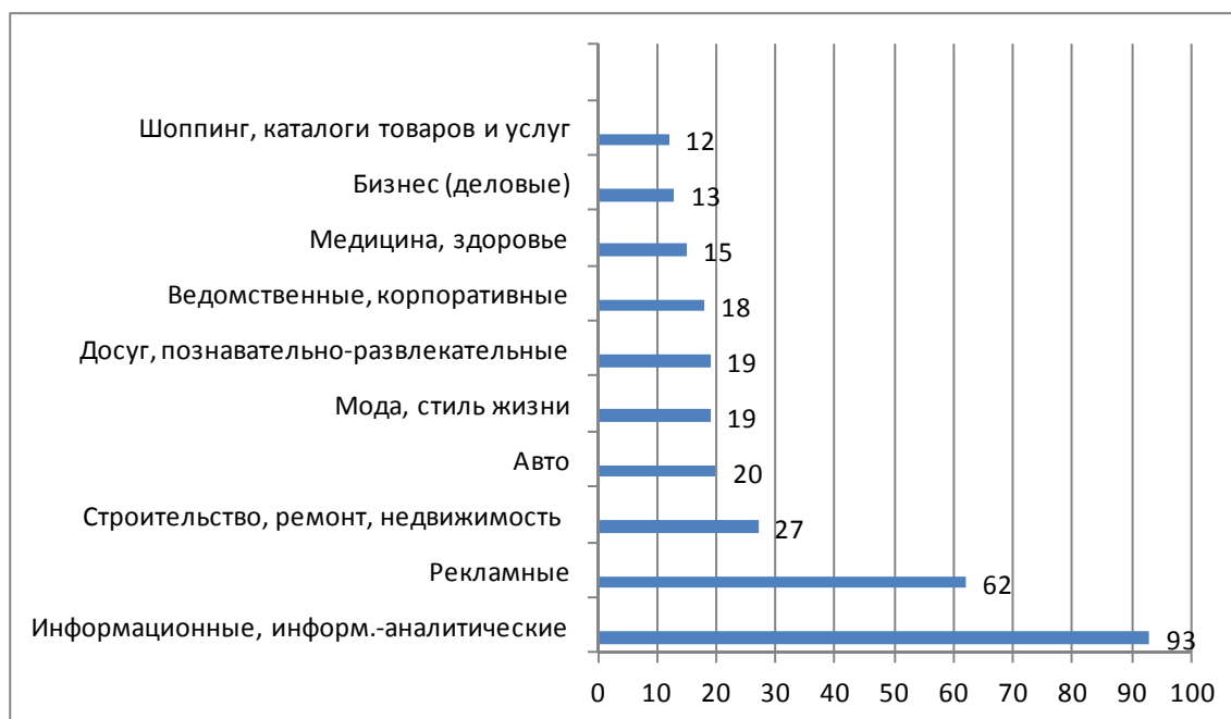
Рис. 2. Топ-10 тематик региональных печатных СМИ, зарегистрированных и открытых в 2010 г.

Особенности развития региональных периодических изданий определяются несколько иными характерными чертами как внутреннего, так и внешнего порядка. Во-первых, региональные СМИ, прежде всего, отражают проблематику местного значения (рис. 2), не всегда корреспондирующуюся с общенациональной, воспроизводят круг вопросов, вытекающих из регионального политического и социально-экономического процессов, приспособляются к «повестке», формулируемой местной культурной, политической и бизнес-элитой. Во-вторых, местным СМИ характерна «экономическая и политическая зависимость от органов власти – их учредителей, других групп влияния» [8, с. 5].