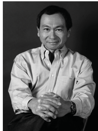
Фото: Френсис Фукуяма

«Все страны, подвергшиеся экономической модернизации, должны весьма походить друг на друга , – развивает Ф. Фукуяма главный тезис своей статьи в книге. – В них должно существовать национальное единение на базе централизованного государства, они урбанизируются, заменяют традиционные формы организации общества... экономически рациональными формами, основанными на функции и эффективности, и обеспечивают своим гражданам универсальное образование. Растет взаимосвязь таких обществ через глобальные рынки и распространение универсальной потребительской культуры. Более того, логика современной науки, по-видимому, диктует универсальную эволюцию в сторону капитализма . Опыт Советского Союза, Китая и других социалистических стран указывает, что хотя весьма централизованная экономика была достаточна для достижения уровня индустриализации, существовавшего в Европе пятидесятых годов, она разительно неадекватна для создания того, что называется сложной «постиндустриальной» экономикой, в которой куда большую роль играют информация и технические новшества» [13].