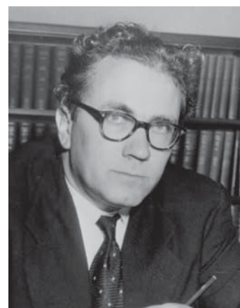
Фото: Стейн Роккан

С. Роккан предпринял масштабную и амбициозную попытку составить геополитическую карту Европы, в контекст которой вписывалась и проблема модернизации. Как отмечает С. Ларсен, Роккана «интересовали длинные ряды макроисторического развития, и он использовал их для объяснения избранного на сегодня пути по таким направлениям, как формирование нации, формы государственных структур, региональные различия политической жизни, временные рамки демократизации, сохранение основных расколов-кливажей... Его знаменитая «теория Европы» (или «теория Западной Европы», как бы мы сейчас назвали эту работу) основана на сочетании методов ретроспективного и перспективного анализа (инструментализм)» [4].