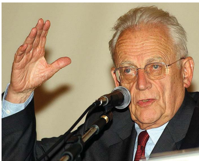
Фото: Алан Турен

Особое место в работах А. Турена занимает анализ социалистической модернизации или «контрмодернизации» 1 . Но, рассматривая эволюцию коммунистического режима, французский исследователь делает вывод о победе в социалистических странах ути-