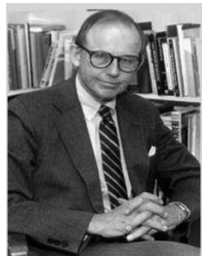
Фото: Самюэль Хантингтон

«...У современных обществ есть много общего. Но обязательно ли они должны слиться и стать однородными? Аргумент в пользу этого основывается на том предположении, что современное общество должно соответствовать единому типу – западному, что современная цивилизация – это западная цивилизация и что западная цивилизация есть современная цивилизация. Тем не менее это совершенно ошибочная идентификация» [16, с. 94].