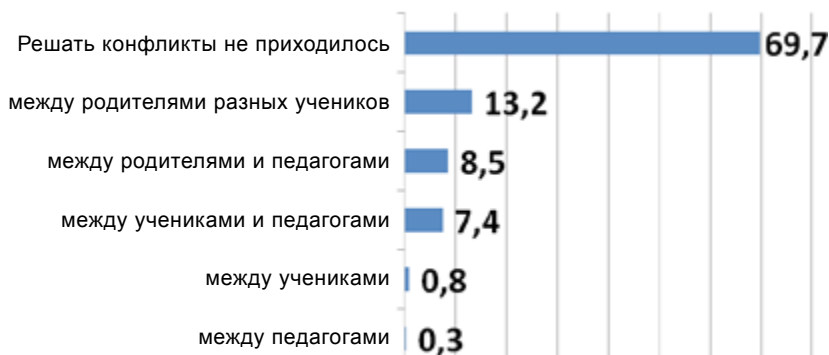
Рис. 3. Распространённость конфликтных ситуаций, решаемых управляющими советами школ

Что же мешает эффективной деятельности советов, по данным опроса? Основная помеха деятельности Советов – некомпетентность, о ней заявили более 30% опрошенных, и пассивность (по разным причинам) их членов, об этом говорят около 30% респондентов. В 20% неуспех управляющих советов объясняется очевидным образом: коллектив школы прекрасно справляется со всеми задачами и не нуждается в помощи. В 12% члены совета не понимают своих задач и полномочий – это тоже можно отнести к некомпетентности. При этом отсутствие компетентности указывают в основном работники системы образования, а загруженность – представители родительской общественности [9].