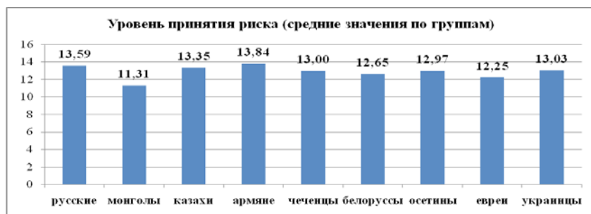
Рис. 4. Уровень принятия риска в группах подростков

У остальных групп подростков выявлен средний уровень выраженности принятия риска, что предполагает наличие у них убежденности в том, что все то, что случается, способствует их развитию за счёт знаний и приобретённого опыта. Таким образом, у испытуемых проявляется стремление относиться к жизни как к способу открытия нового и готовность действовать без надежных гарантий успеха, на свой страх и риск.