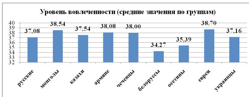
Рис. 2. Уровень вовлеченности в группах подростков

Представленные на рис. 2 данные уровня вовлеченности позволяют отметить его низкий показатель в группах подростков белорусов и осетин. Для них характерна слабая убежденность в том, что вовлеченность в происходящее даёт максимальный шанс найти нечто стоящее и интересное в