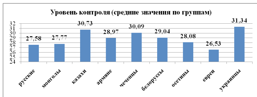
Рис. 3. Уровень контроля в группах подростков

жизни. В этих этносах более выражено чувство отвергнутости и ощущения себя «вне» жизни.