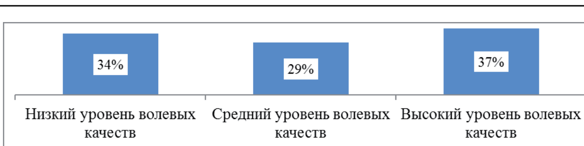
Рис. 2. Распределение уровней волевых качеств руководителей организаций (%)

Этот тезис подтверждается тем, что руководители со средним уровнем волевых качеств имеют стаж работы от 5 до 10 лет и выше. Опытные менеджеры, проработавшие более 10 лет, как правило, имеют высокий уровень