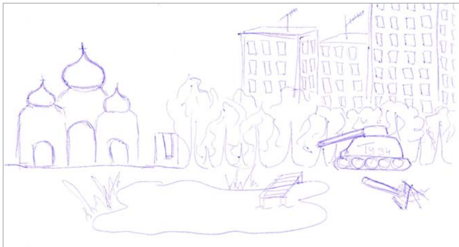
Рис. 2 / Fig. 2. Внешнеполитический образ России (мужчина, 57 лет, высшее образование, Томская область) / Foreign policy image of Russia (male 57 years old, higher education, Tomsk region)

Положительную характеристику содержат в себе 33,9% рисунков, из чего следует, что на неосознаваемом уровне восприятия образ России более позитивный, чем на рациональном. Кроме этого, были рисунки, изображавшие негативные, нейтральные и амбивалентные характеристики. Негативные компоненты России присутствовали в 13,7% случаев, что свидетельствует о том, что на неосознаваемом уровне восприятия образ России привлекательный.