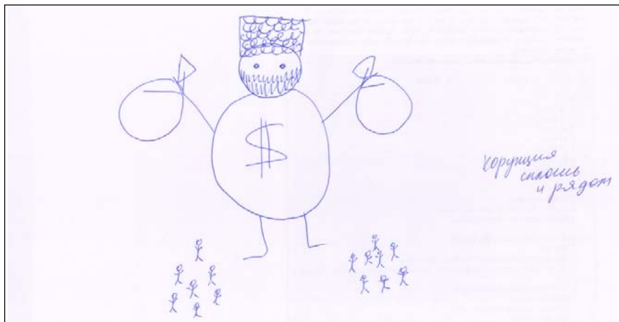
Рис. 3 / Fig. 3. Образ российской власти (мужчина, 65 лет, высшее образование, республика Дагестан) / The image of the Russian government (male, 65 years old, higher education, the Republic of Dagestan)

На примере рисунка 3 видно, что в понимании граждан представители власти нацелены на своё обогащение, а интересы народа, по мнению респондентов, не попадают в поле зрения чиновников. Кроме этого, стоит отметить, что образ политической власти Российской Федерации в большинстве случаев лишён субъектности.