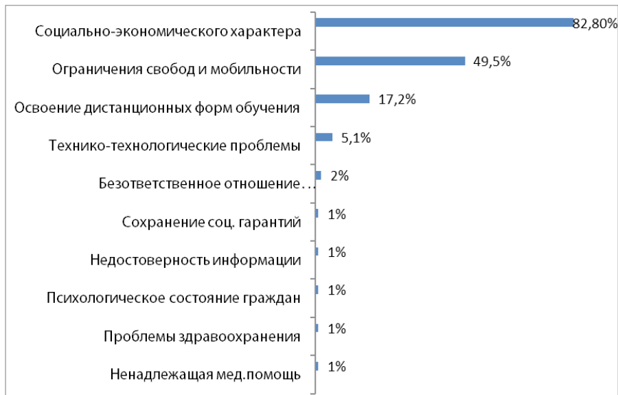
Рис. 1 / Fig. 1. Актуальные для молодёжи проблемы в период пандемии коронавируса / Actual problems for young people in a pandemic

Проведённый онлайн-опрос выявил круг актуальных для современной российской молодёжи проблем. Наиболее значимыми для 82,8% опрошенных в условиях распространения COVID-19 оказались проблемы социально-экономического характера. В их числе – безработица/угроза потери рабочих мест, сокращение доходов, рост цен. 49,5% участников анкетирования отметили трудности, вызванные ограничением свободы и мобильности, 17,2% – сложности, связанные с освоением дистанционных форм обучения (Zoom, Moodle и пр.). Полный спектр проблем представлен на рисунке 1.