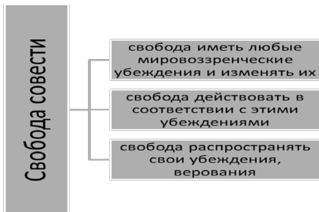
Рис. 2. Специфика понятий свобода совести и свобода вероисповедания