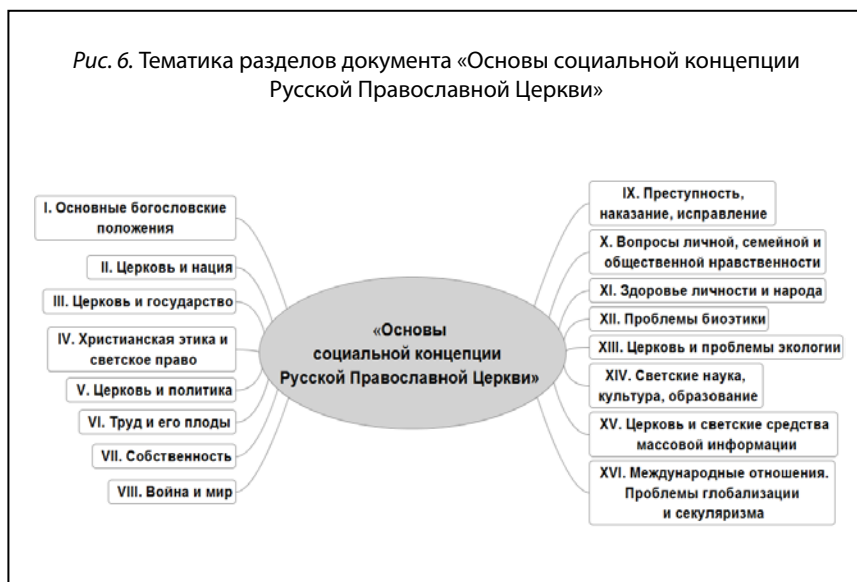
Рис. 6. Тематика разделов документа «Основы социальной концепции Русской Православной Церкви»

4 февраля 2011 г. Архиерейским Собором Русской Православной Церкви был принят документ, регламентирующий развитие православ-