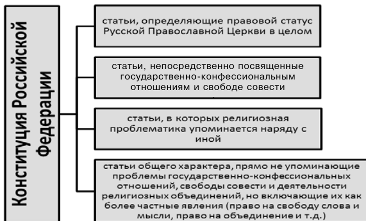
Рис. 4. Классификация статей Конституции РФ, связанных с обеспечением свободы совести, свободы вероисповедания и с деятельностью религиозных объединений

совести, свободы вероисповедания и с деятельностью религиозных объединений, включены в Конституцию РФ [9] (рис. 4.).