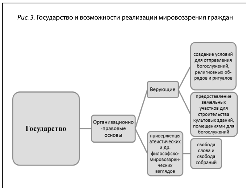
Рис. 3. Государство и возможности реализации мировоззрения граждан

Гражданам, не проявляющим каких-либо убеждений, не требуется реализовывать себя в различных формах социальной активности. Однако как атеистам, так и верующим требуется проявлять свое мировоззрение в действии, поэтому в рамках реализации свободы совести со стороны государства необходимо обеспечение правовых и организационных основ для таких действий. Атеистам достаточно предоставить свободу слова и свободу собраний. Но для верующих, ввиду необходимости отправления богослужений, религиозных обрядов и ритуалов, свобода совести должна включать и возможности обзавестись земельными участками для строительства культовых зданий, помещениями для богослужений – вне этого свобода совести может обернуться фикцией (рис. 3).