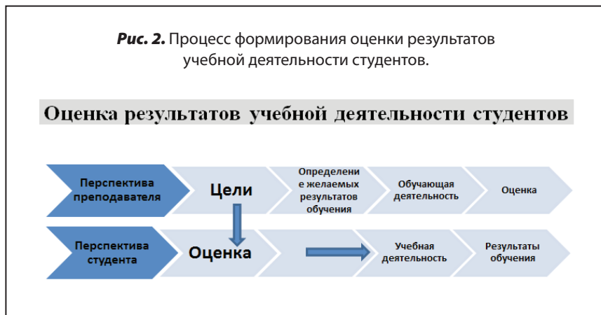
Рис. 2. Процесс формирования оценки результатов учебной деятельности студентов.

Если учебная программа отражается в оценке, как обозначено стрелкой, обучающая деятельность преподавателя, а также учебная деятельность студента направлены к одной и той же цели. Подготовка к этим оценкам будет проходить через изучение учебной программы. Желаемые результаты обучения не следует определять элементарно, то есть в терминах полученных оценок. Предполагаемые результаты обучения относятся скорее к искомому качеству исполнения, поэтому о фактических результатах обучения студентов нужно судить по этим