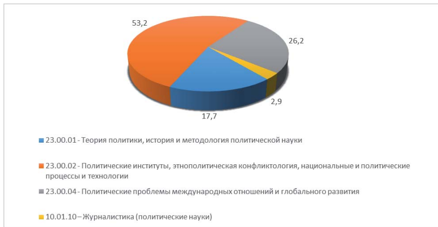
Рис. 2. Распределение докторских диссертаций по политическим специальностям с 2001 по 2006 гг. (%).

которым защищены политологические диссертации. Проанализировавший докторские диссертации 2001–2006 гг. Я.А. Пляйс приходит к заключению, что наиболее востребованными темами научных работ того периода были связанные с внутренней политикой страны (выполненные по научной специальности 23.00.02) (см. рис. 2).