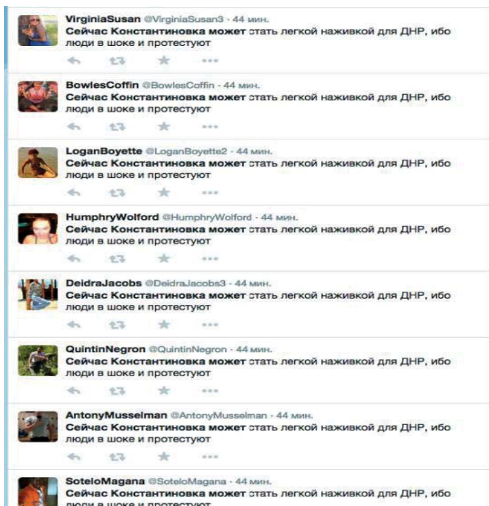
Рисунок 1. Выявление политических ботов в ручном режиме [19]

совершенно идентичными по содержанию, публиковались разными пользователями в разное время (на рис. 1 заметно, что «разные» пользователи одновременно «постят» одинаковую фразу).