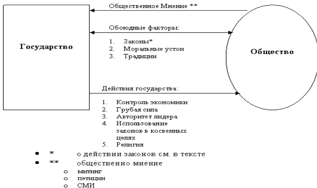
Схема 4. Взаимодействие государства и общества.

Важнейшим условием гармонического развития и функционирования институтов гражданского общества и институтов государства и права, выступает их взаимосвязь. Произшедшие на рубеже XX-XXI веков сдвиги в развитии политической системы общества вывели Россию из ситуации, когда политический режим ставил почти непреодолимые препятствия широкой гражданской самоорганизации. Вместе с тем, взаимоотношения институтов гражданского общества и государственных органов в настоящее время далеки от идеала.