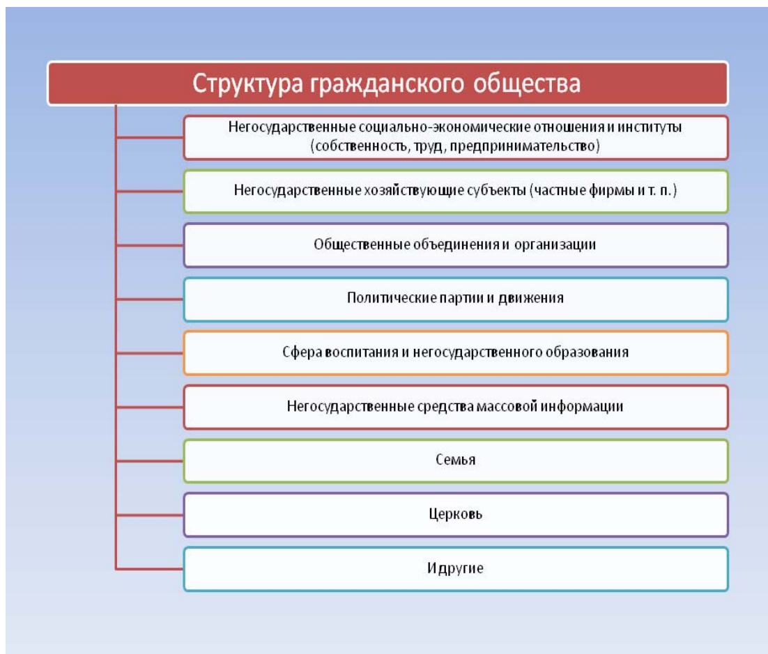
Схема 3. Структура гражданского общества.

Анализируя вышеприведённую классификацию, хочется отметить, тот факт, что структура гражданского общества может быть представлена как совокупность различных видов общественных отношений, объединений граждан, их ассоциаций, групп давления (лобби), различных видах некоммерческих организаций, религиозных и иных организаций на добровольных началах, которые выражают интересы различных социальные групп общества.